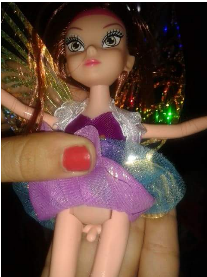
La poupée « trans » qui fait réagir en Argentine.

Dans les magasins de jouets, on peut trouver des poupées chanteuse, cavalière, sirènes ou princesses. Bref, les jouets stéréotypés auxquels on nous a habitués depuis notre tendre enfance. Las de ces codes, certains pourraient avoir décidé d'innover en brouillant les pistes. En Argentine, une famille qui avait offert une poupée ailée en robe et paillettes a eu la surprise de constater que sous sa jupe, elle portait (non pas une culotte) mais des attributs masculins.